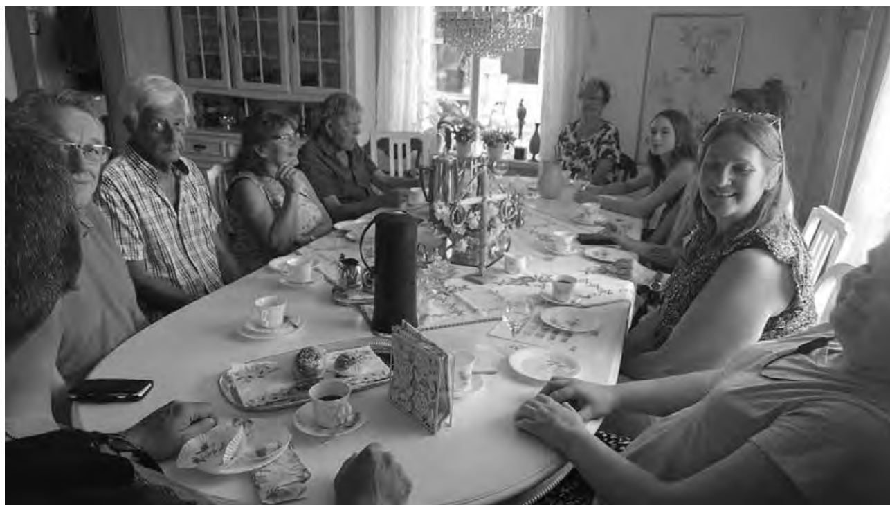
Kaffe och hembakta bullar i Herrsjötorp

släppa in oss i den vackra kyrkan i Bjurtjärn. Vi kunde också se några gamla gravar där våra släktingar ligger.