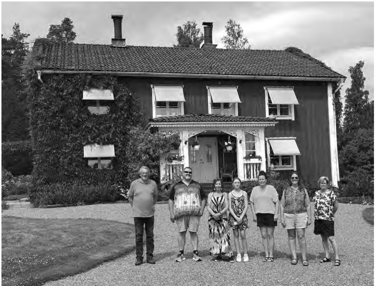
Stensviken – platsen för släktingarnas gemensamma ursprung