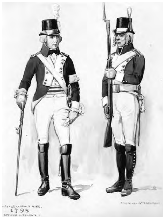
Plansch med uniform för officer och soldat vid Västgöta-Dals regemente 1798, ritad av Einar von Strokirch

»Hela serien som förvaras på Krigsarkivet och kallas Generalmönsterrullor består totalt av 1945 volymer.«