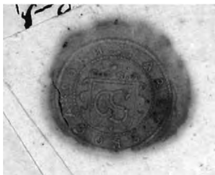
Karlskoga härads (sockens) sigill under 1600-talet

Skriften som omfattar ca 740 sidor finns på Görans hemsida. I dokumentet kan du söka efter byar och personer eller efter olika typer av mål vid tinget som till exempel slagsmål, jordatvister, mökränkning, hemmansupptagning, fastighetsaffärer m.m.